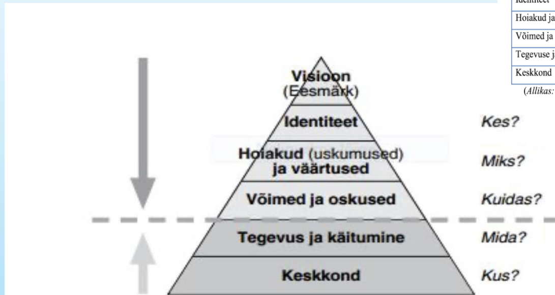
Tabel 1 Diltsi tasandid ja küsimused