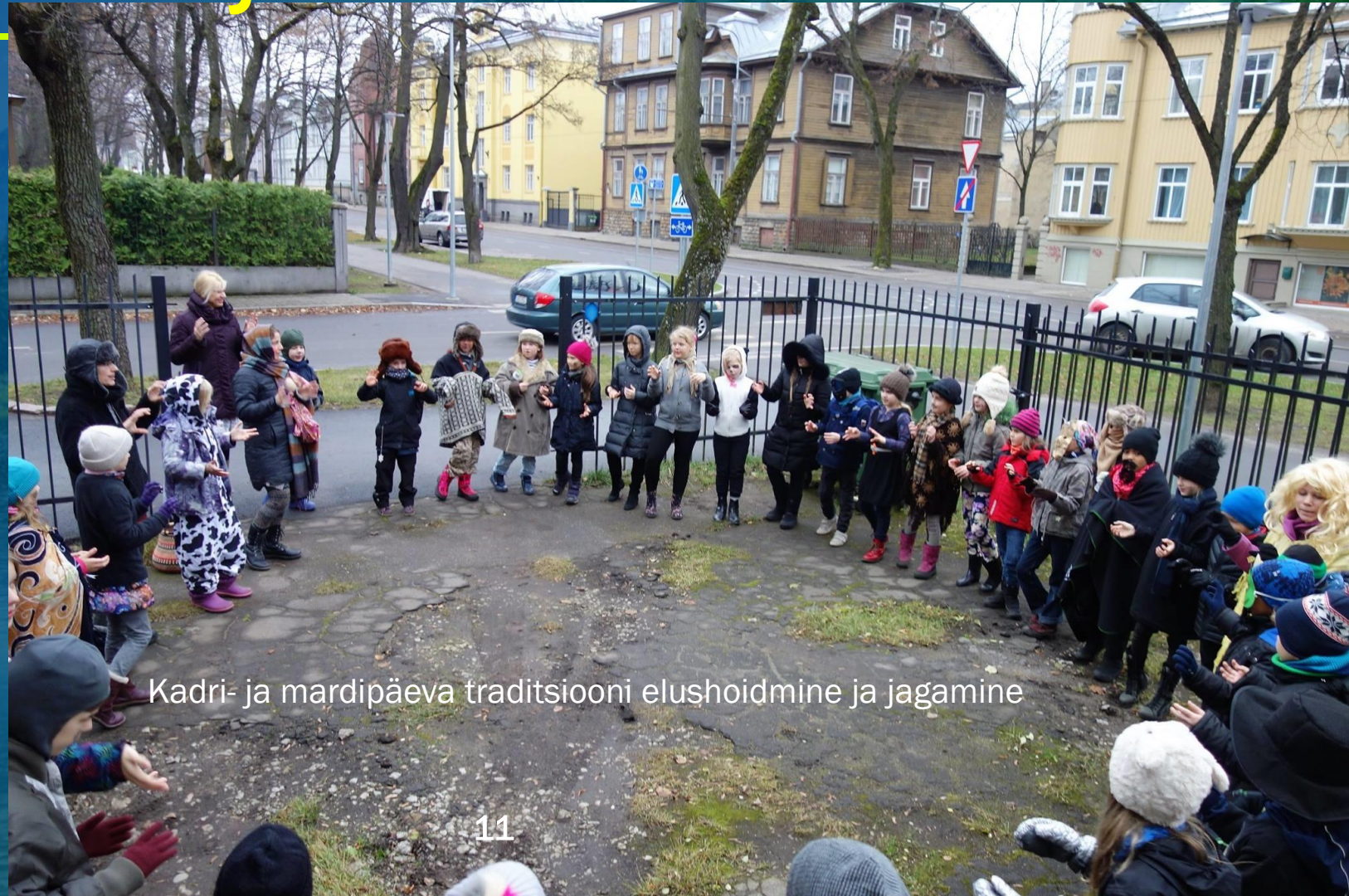
Kadri- ja mardipäeva traditsiooni elushoidmine ja jagamine

KUURÜTM – kuu teema kulgemine läbi erinevate ainete, projektide valmimine, huvipõhine õpe