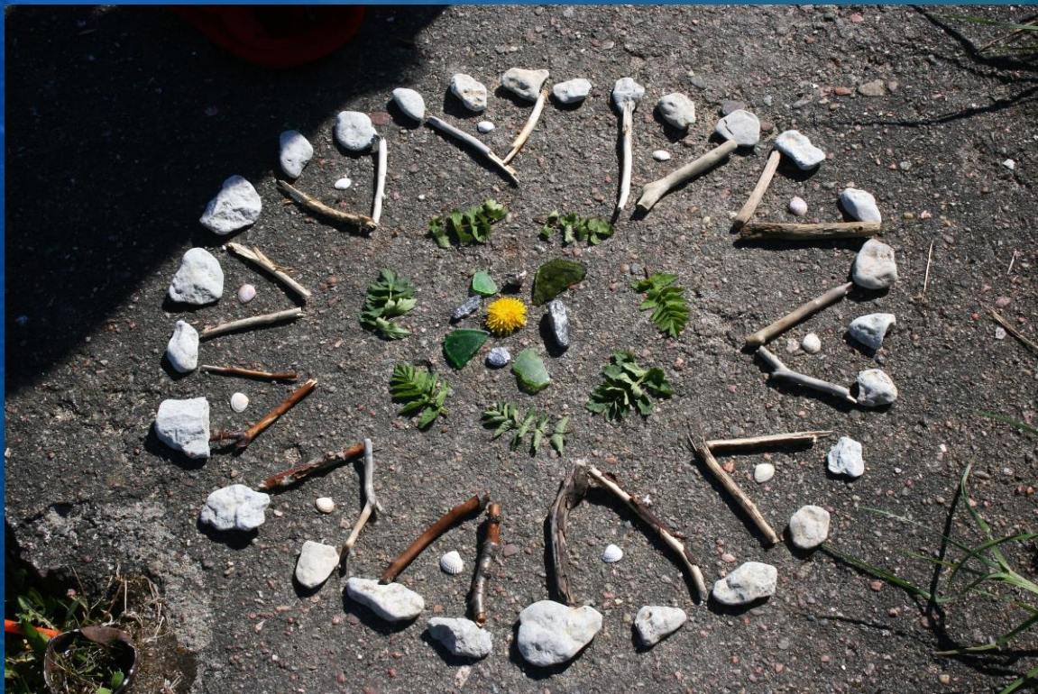
GAIA VÄÄRTUSTE MANDALA