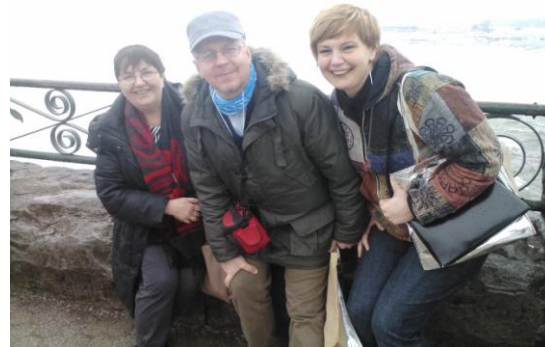
Foto 2. Niagara jõe taustal